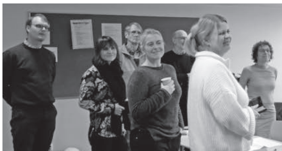
Seminar deltakerne jobber godt sammen.