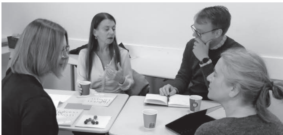
Kolleger fra ulike deler av landet møtes.